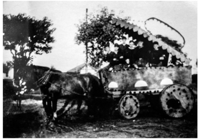
La gente tiraba serpentina y papel picado. A las 12 de la noche terminaba el curso y empezaba el baile en el Club A. Funes. La orquesta estaba compuesta por músicos de Funes.