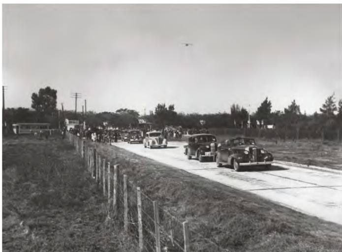
Imagen captada el 5 de junio de 1937 con motivo del acto de inauguración de la Ruta 9, encabezado por el presidente Agustín Justo.

El momento llegó. Allí viene, allí viene!!! Agiten las banderitas ordenó la maestra que nos había dado una a cada uno y nosotros cumplimos la orden al pie de la letra, con los ojos bien abiertos para no perder detalles. Por fin una pick up Ford 35 verde oliva paso, en la caja posterior el presidente con cuatro o más personas saludando de derecha a izquierda.