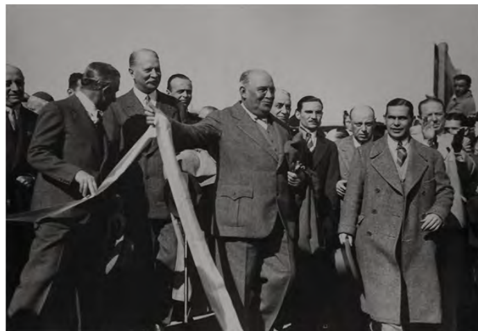
Inauguración pavimentación Ruta 9 frente al Country JCR donde todavía hay una placa recordatoria.

Como lo vi al presidente? Envuelto en un sobretodo de uniforme con gorra militar era el Gral Agustín P. Justo, detrás seguía una caravana de autos que se diluyen en el recuerdo. Volvimos a la escuela sin darnos cuenta del jalón que se había plantado en aras del progreso.