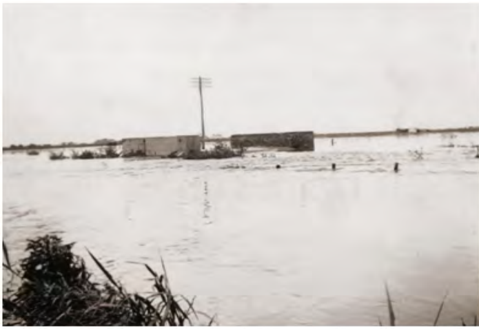
Inundación del año 1931

Cuando se construyó la ruta 9, inaugurada, paso en un auto descapotado el presidente de la Nación General Justo. 2 A los alumnos de la escuela nos llevaron a verlo pasar a la plaza San José, que en ese tiempo era la cancha de fútbol del Club Atlético Funes. Aquí no había motocicletas y solo dos automóviles, uno pertenecía al administrador de la estancia La polola y el otro al comisario.