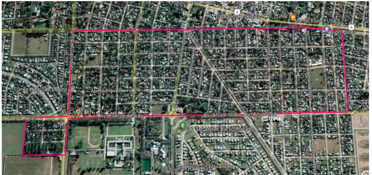
Figura 1: Localización del área a intervenir.